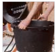
Gemisch ist nach Anrichtung in der Wanne transportierbar