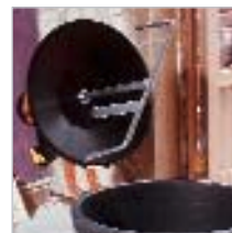
Einfach zu reinigende Wanne und Schaufeln