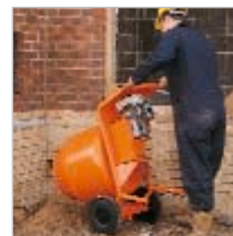
Räder sorgen für mühelosen Transport