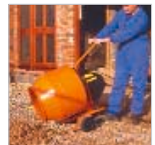
Die Maschine wird ohne Probleme an den Einsatzort gefahren