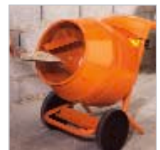
Kompakt, ideal für kleinere Arbeiten