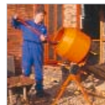
Der leichte, aber leistungsstarke Minimix 130 mischt eine ganze Schubkarrenladung