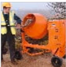
Die Maschinenkonstruktion ist auch den anspruchsvollsten Einsatzbedingungen gewachsen