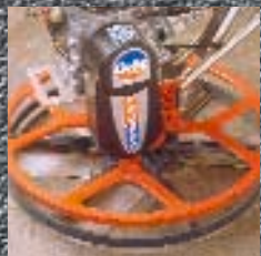
Pro Screed 600

Las fratasadoras Ride-on proporcionan la solución económica para grandes pisos. El bajo centro de gravedad mejora la estabilidad, facilita el trabajo a los operadores y les permite tener un mejor control.