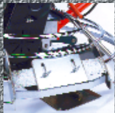
Bastidor de elevación y protección de motor