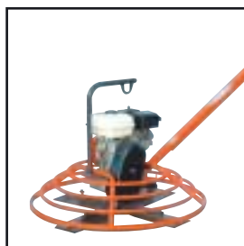
Utility Pro 900/1200